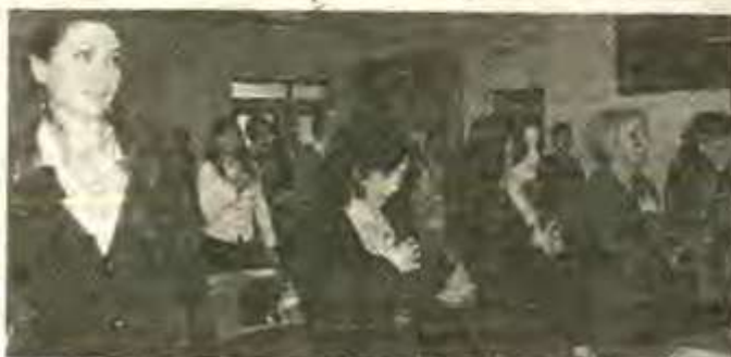
Jurământul a fost rostit cu mâna dreaptă pe inimă